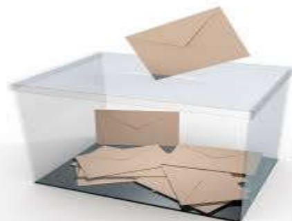
Document 3 : Une urne

Consigne de travail : Effectue les tâches suivantes.